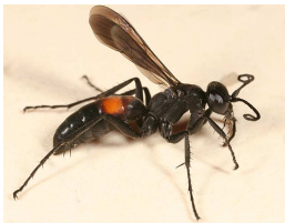
LA GUÊPE SOLITAIRE