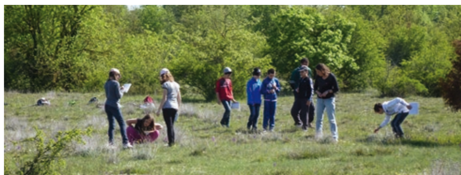
Le Conservatoire d'espaces naturels de Poitou-Charentes intervient sur les espaces naturels de La Couronne depuis 2000.

1 SCOT : Schéma de Cohérence Territoriale