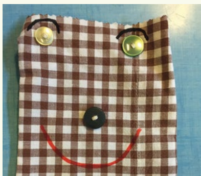
Travail de couture réalisé lors des ateliers

D'autres thèmes sont abordés tout au long de l'année avec des ateliers couture, jardinage et une sensibilisation au développement durable.