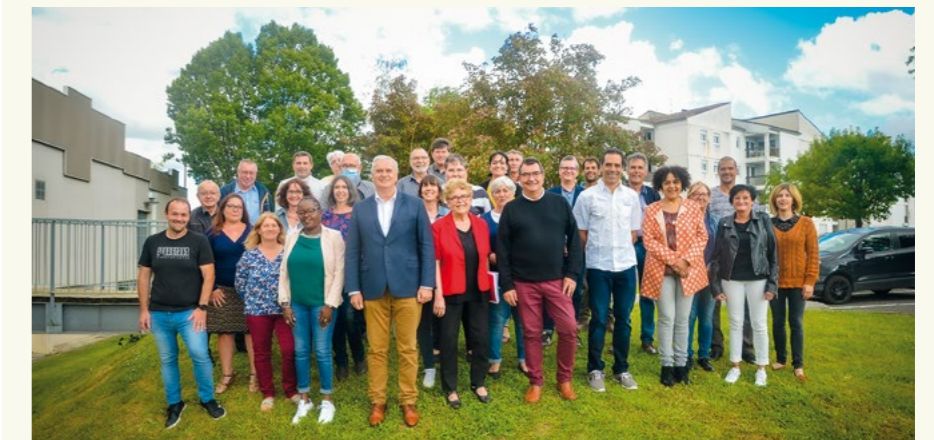
Photo réalisée avant protocole sanitaire COVID-19

Plus de renseignements sur : www.lacouronne.fr